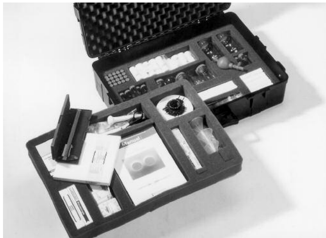
Schutz vor gefälschten Arzneimitteln: Das GPHF-Minilab®