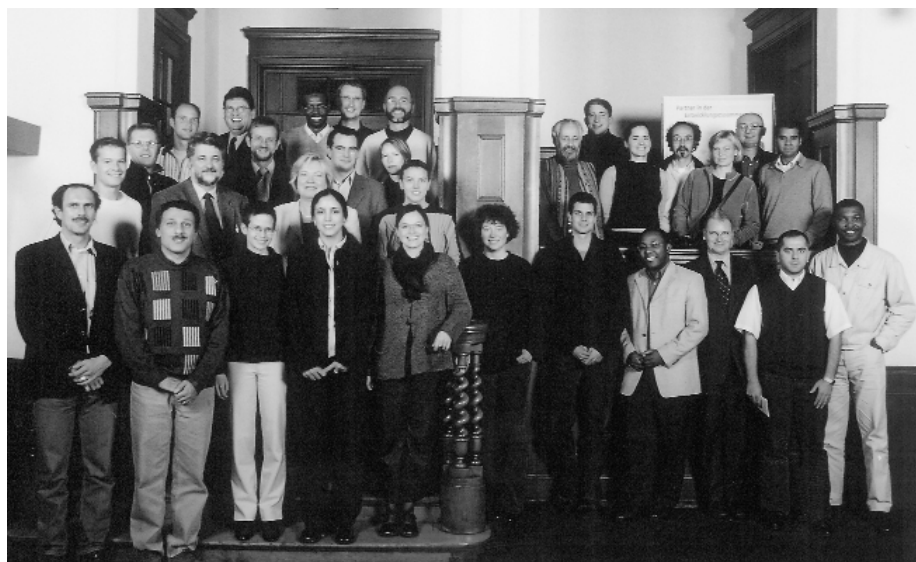
Teilnehmer und Referenten des 1. GPHF-Fortbildungsseminars Management der Arzneimittelversorgung in Entwicklungsländern.

Der German Pharma Health Fund e.V. (GPHF) bot vom 20. bis zum 25. Oktober erstmals ein Fortbildungsseminar über das Management der Arzneimittelversorgung in Entwicklungsländern an. Ziel war es, pharmazeutische, ökonomische und rechtliche Prinzipien in ein Gesamtkonzept zu stellen und durch praxisnahes Wissen um die besonderen Bedingungen und Anforderungen der Arzneimittelversorgung in den Entwicklungsländern zu ergänzen. Partner des GPHF bei der Entwicklung und Durchführung des Seminars war das Pharmazeutische Institut der Universität Mainz.