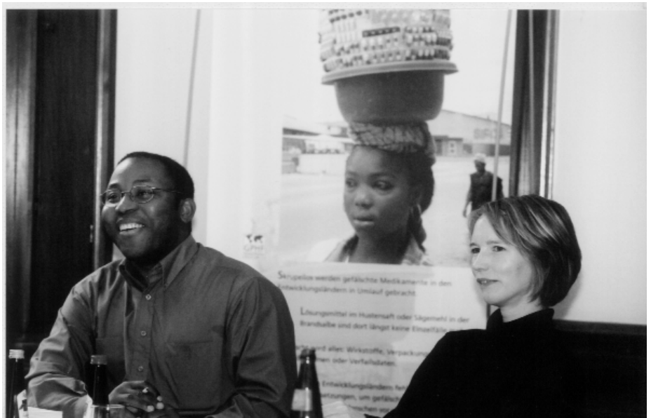
Fünf Tage diskutierten die Teilnehmer alle Aspekte der Arzneimittelversorgung in Entwicklungsländern.

Der GPHF plant, das Seminar gemeinsam mit der Universität Mainz